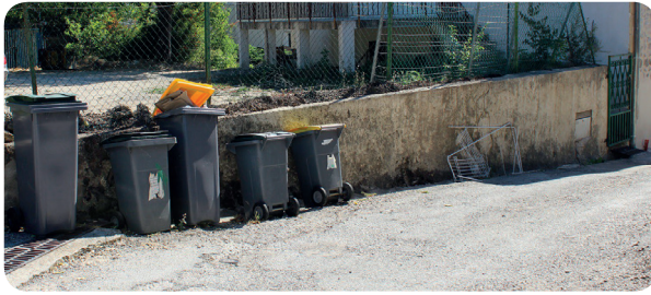
Chemin de Pareloup

Veiller à ne pas déposer vos objets encombrants dans les rues, mais les apporter aux déchetteries de : Quissac ou Villevieille (à l'entrée de Junas)... Les éboueurs ne ramassent pas les encombrants.