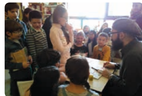
Séance de Dédicaces personnalisées dans la classe sur les carnets de lecture.